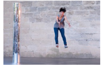
SEPTEMBRE 2015 : LES RENDEZ-VOUS À NE PAS MANQUER